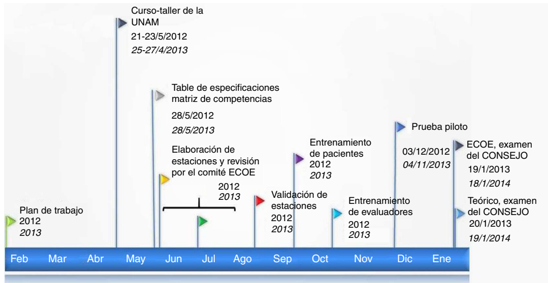
Figura 1. Cronograma de la estrategia de diseño del examen clínico objetivo estructurado.